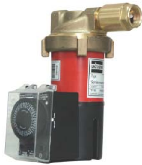
UPH-15-15W. Безваловый циркуляционный насос с недельным таймером для системы горячего водоснабжения.