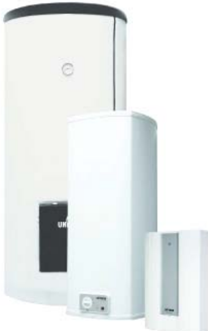
Электрические водонагреватели UNITHERM на любой вкус: напольный емкостной водонагреватель US, настенный бойлер US...Z с одно- и трехфазным подключением и изменяемой мощностью, гидравлический однофазный проточник UDH.