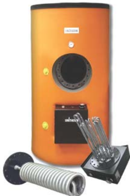
US 1002 Uni. Универсальный емкостной водонагреватель, позволяющий осуществлять нагрев с помощью электроТЭНа, водоводяного теплообменника или с использованием обоих способов нагрева.

Berliner Chaussee, 2, D-15749, Mittenwalde / Germany, Fon: +49(0)33764 84 210 Fax: +49(0)33764 84 211 E-mail: info@unitherm-haustechnik.de Internet: www.unitherm-haustechnik.de