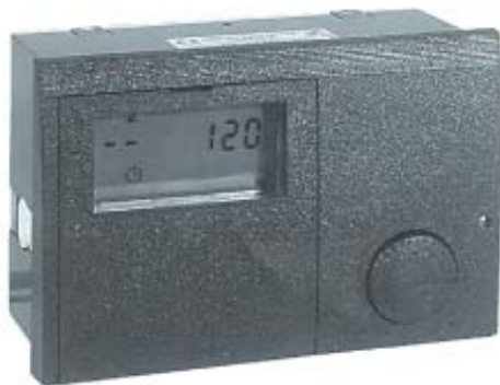
UAW 4. Погодозависимый регулятор, способный обслужить до 15 отопительных контуров и каскад из нескольких котлов.

Безваловые циркуляционные насосы для ГВС серии UPH, предлагаемые фирмой UNITHERM , имеют проходное сечение DN 15 или DN 20 (1/2" или 3/4" соответственно) и оснащены массой полезных функций. Это, в первую очередь, таймер на сутки или на неделю, где Вы можете запрограммировать удобные для Вас периоды включения и выключения насоса, например, утром прямо ко времени подъема или вечером к приходу с работы. Кроме того, немаловажными являются и функция защиты от перегрева и защиты от сухого хода (попадания воздуха).