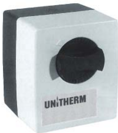
UMM 1. Сервомотор для трех- и четырехходовых смесителей.

UNITHERM предлагает сервомоторы UMM с крутящим моментом от 6 Нм до 25 Нм, различным временем (от 60 до 240 сек.) и углом (от 15° до 345°) поворота. А специальные монтажные комплекты позволяют закрепить сервомотор не только на смеситель UNITHERM , но и на смесители практически всех известных производителей.