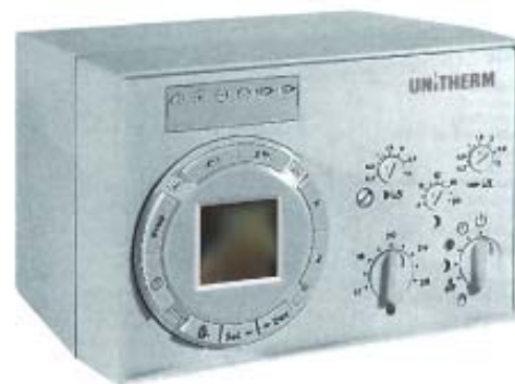
UAW 2M. Сервомотор и автоматика «в одном флаконе».